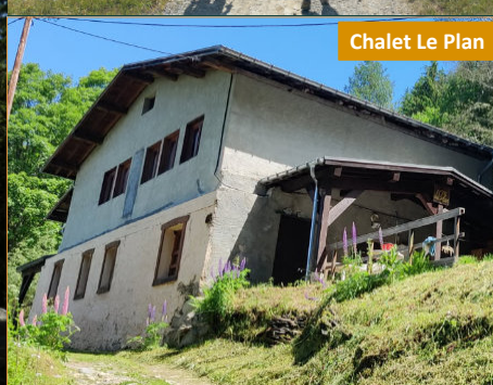
Chalet Le Plan