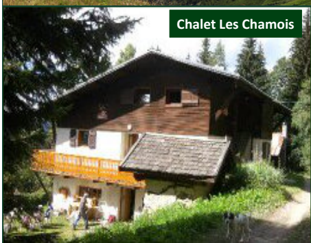
Chalet Les Chamois