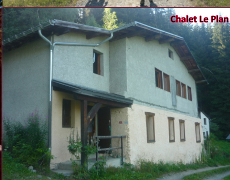
Chalet Le Plan