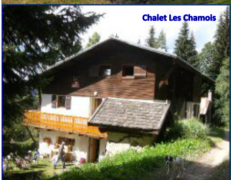
Chalet Les Chamois